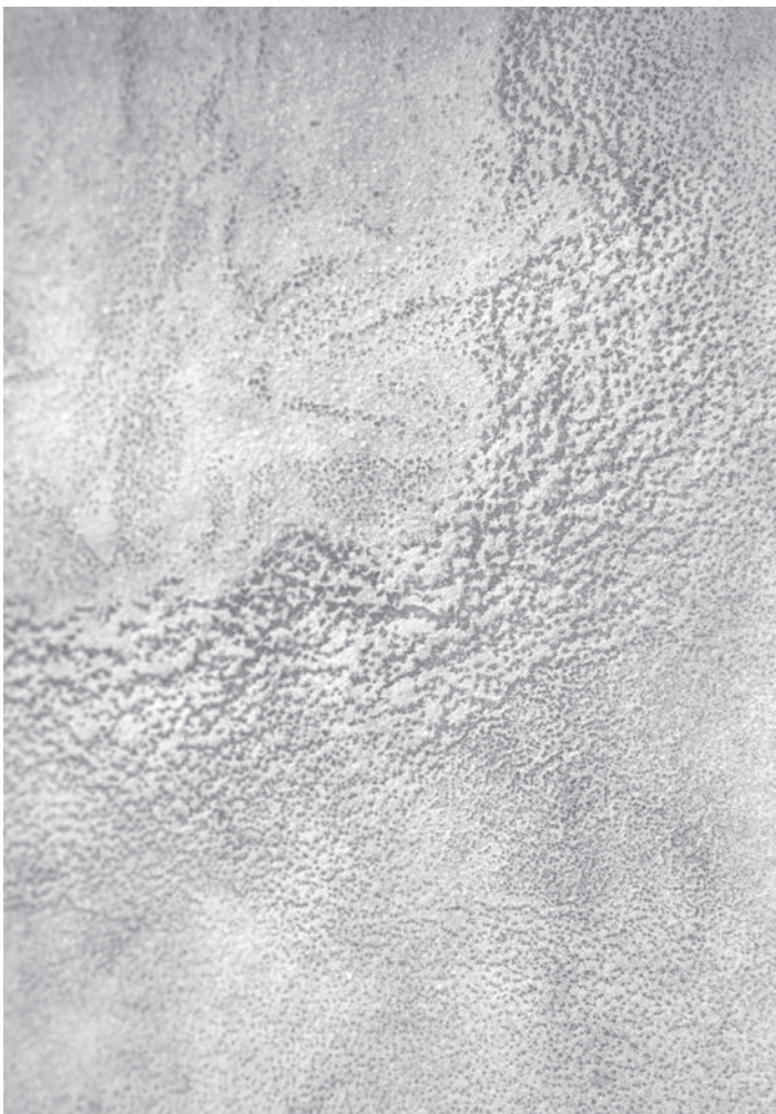
Ilanit Illouz, Évaporites [détail], 2023. Tirage fossilisé au sel. Production CIAPV © droits réservés