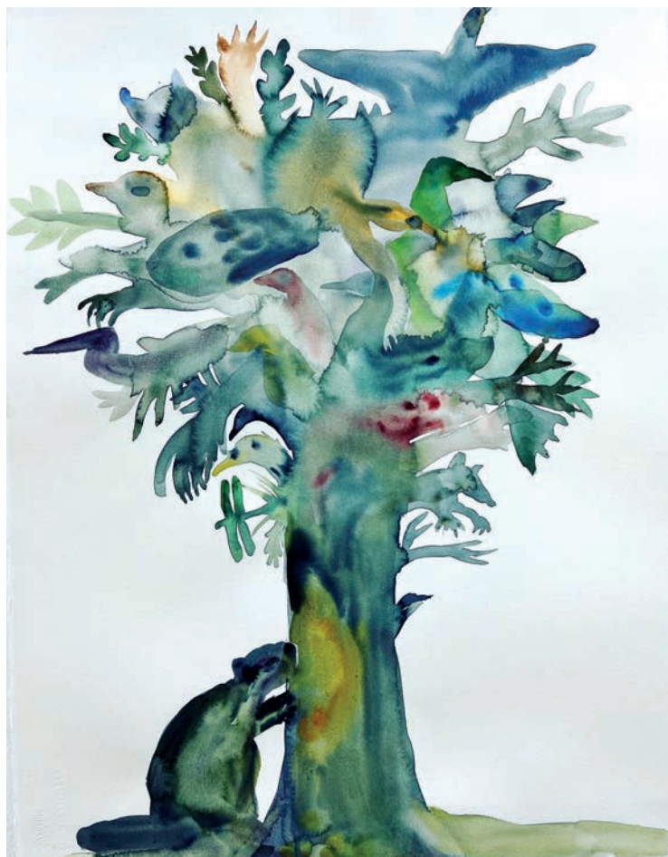
Suzanne Husky, L'arbre de la vie et l'arrière-grand-père castor , 2022 Aquarelle, 77 x 57 cm