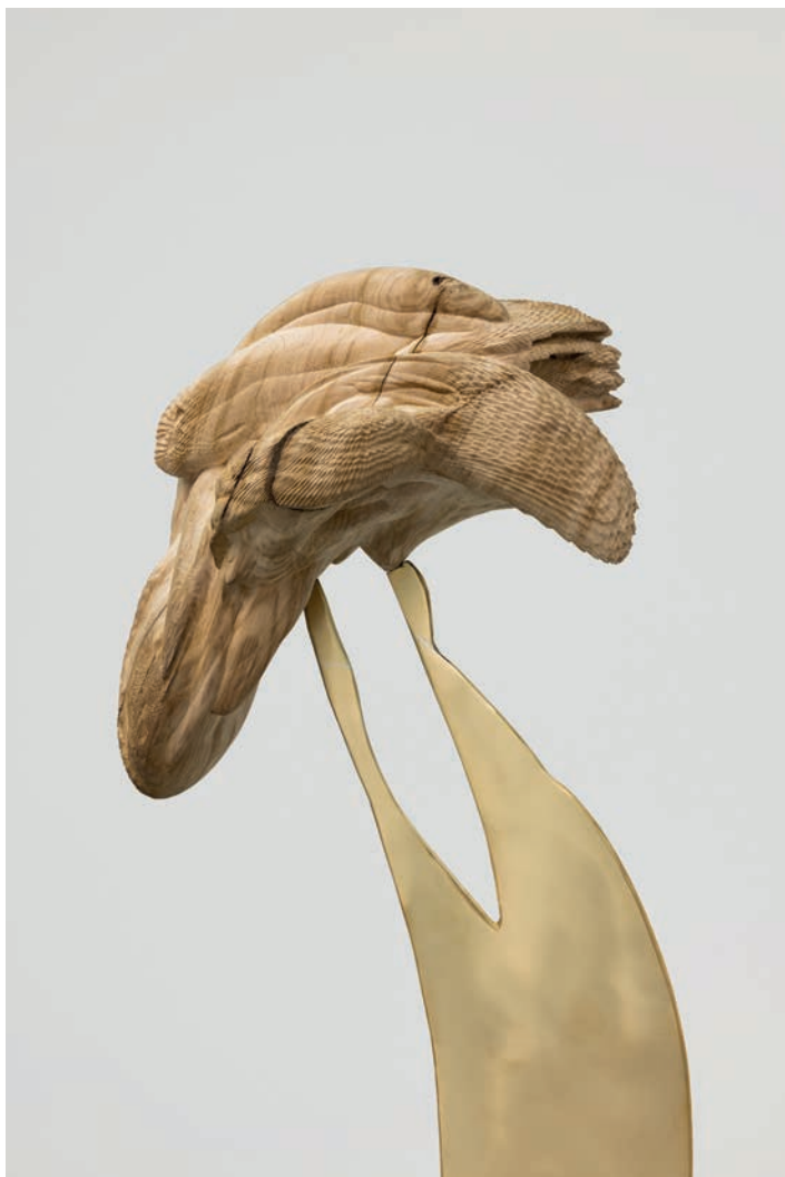
Ittah Yoda, Allan [détail], 2023. Chêne de l'île de Vassivière, laiton brossé, 152 x 63 x 88 cm. Courtesy Ittah Yoda et Galerie Poggi, Paris. Avec le soutien du Cnap © ADAGP, 2023. Photo : © Andrea Rossetti