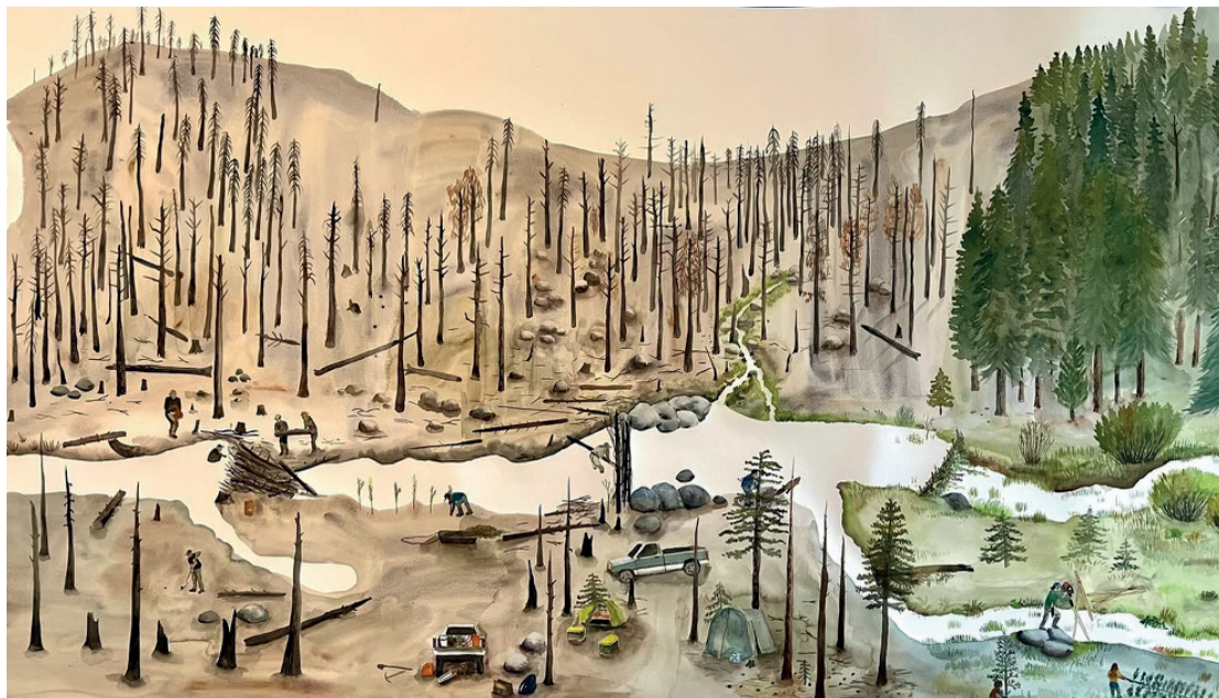
Suzanne Husky, La Parole du Bièvre, construction de barrage castor mimétique , 2023 Aquarelle, 115 x 220 cm. Production Le 19 CRAC