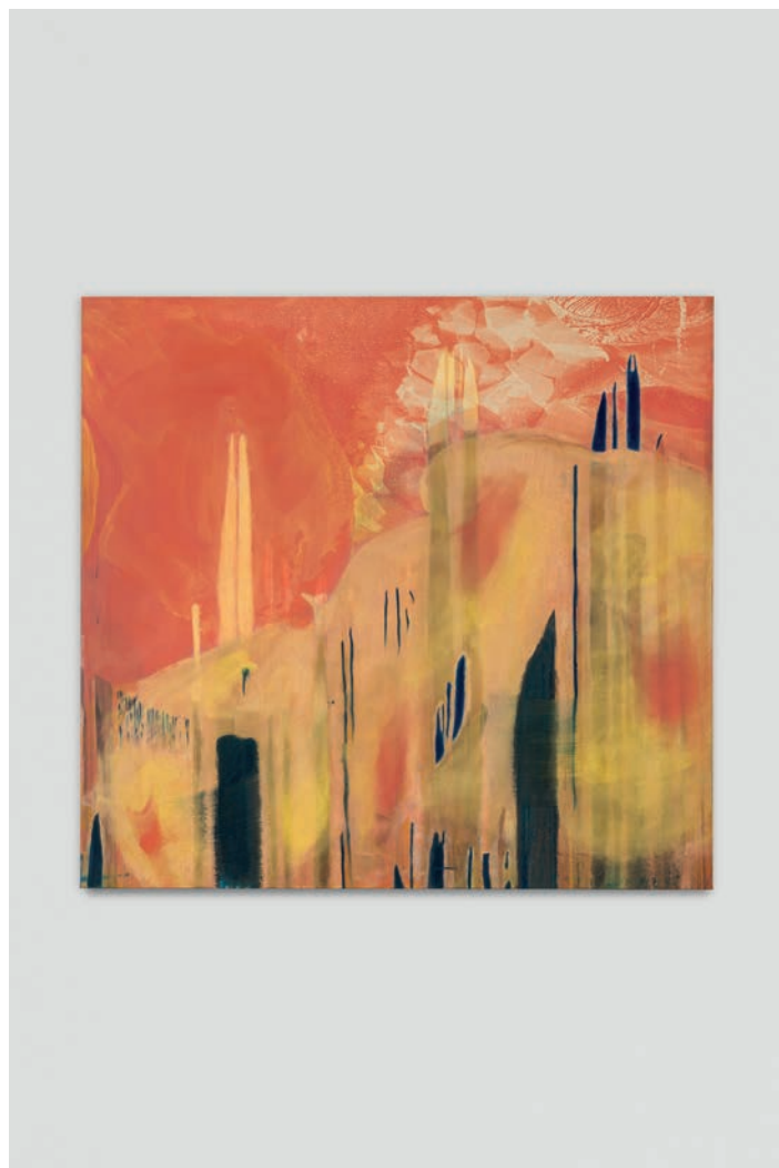
Ittah Yoda, Jean , 2023. Encre lithographique peinte sur toile, peinture à l'aérographe bâtons à huile, pigment fait main par l'artiste, 109 x 116.5 cm Courtesy Ittah Yoda © ADAGP, 2023. Photo : © Andrea Rossetti