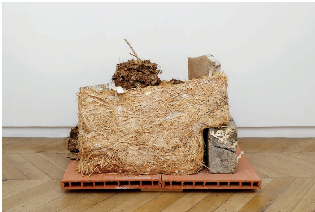
Natsuko Uchino, Assemblage (Mycelium structure) , 2020. Mycelium, feuilles, paille, carton, brique, plâtre, bois 64 x 67 x 100,5 cm.