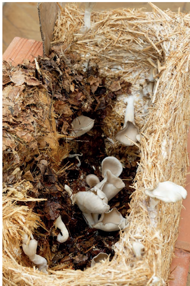
Natsuko Uchino, Assemblage (Mycelium structure) [détail], 2020. Mycelium, feuilles, paille, carton, brique, plâtre, bois 64 x 67 x 100,5 cm.